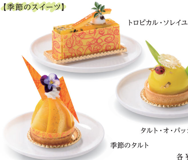
トロピカル・ソレイユ